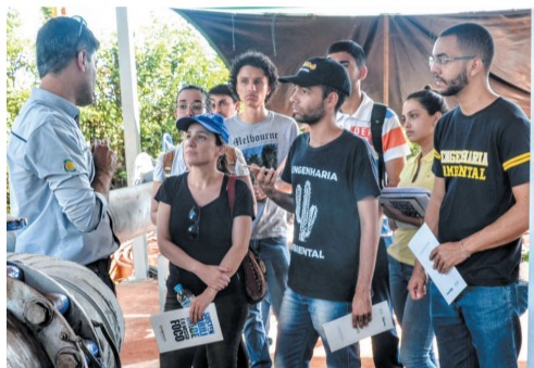
Visita técnica de alunos da UFU à empresa de produção de energia elétrica a partir de biogás oriundo de aterro sanitário

Criada em 2009, a graduação em Engenharia Ambiental da Universidade Federal de Uberlândia passou a ter um novo formato. Com a reformulação do projeto pedagógico, oficializada desde uma resolução do Conselho Universitário de 2017, o curso ganhou uma nova denominação: Engenharia Ambiental e Sanitária.