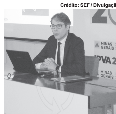
Coletiva foi concedida no dia (3/12), em Belo Horizonte

A apuração do valor venal da frota, que serve de base para o cálculo do IPVA, foi feita por téc-